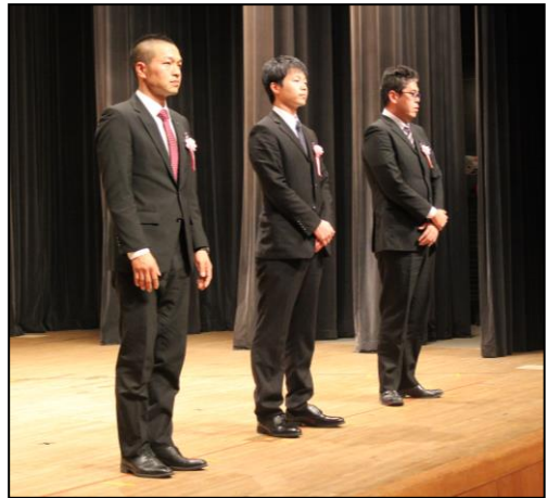
全国技能競技大会入賞者 (第29回技能グランプリ)