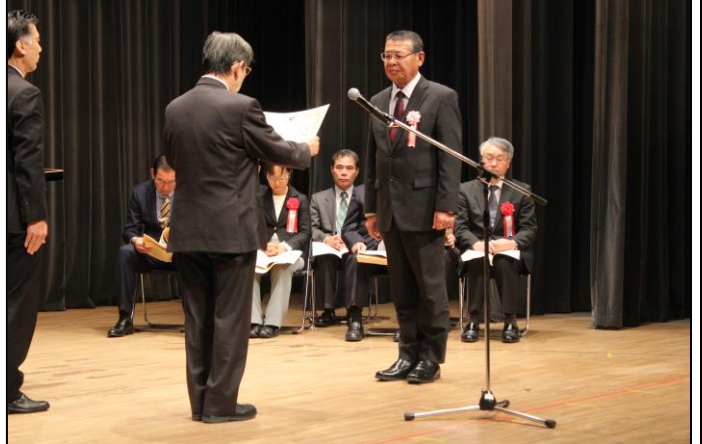
職業能力開発分野功労者（協会長感謝状）