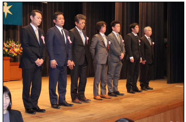
ものづくりマイスター・ITマイスター