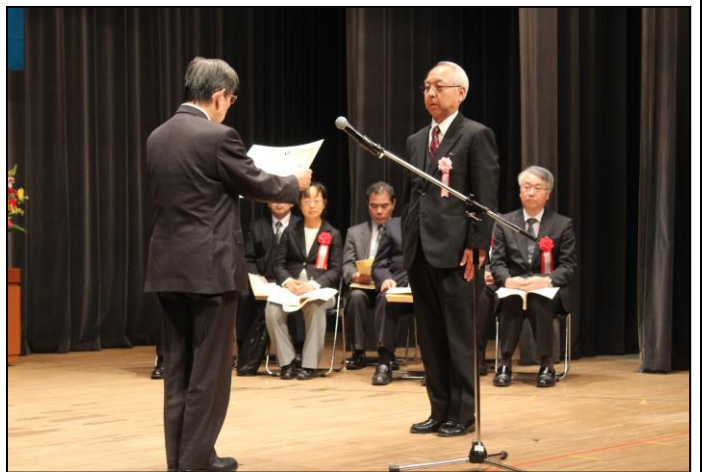
職業能力開発分野功労者（協会長表彰）