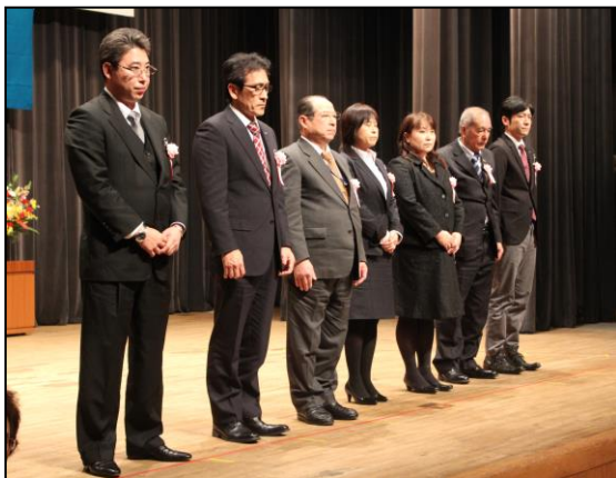
ものづくりマイスター