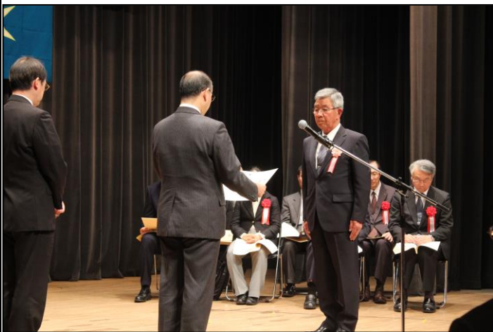
職業能力開発分野功労者（知事感謝状）