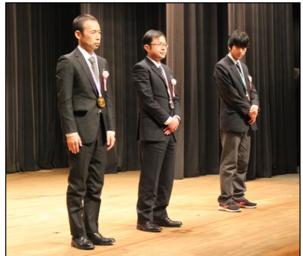
全国技能競技大会入賞者 (第37回全国障害者技能競技大会)