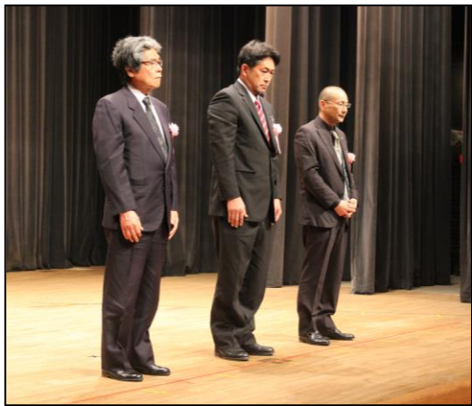
中央職業能力開発協会長表彰受賞者 全国技能士会連合会会長表彰 全技連マイスター認定者