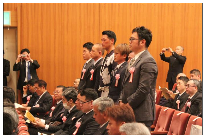
千葉県技能祭（知事賞）