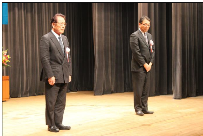
厚生労働大臣表彰受賞者 (職業能力開発関係表彰)