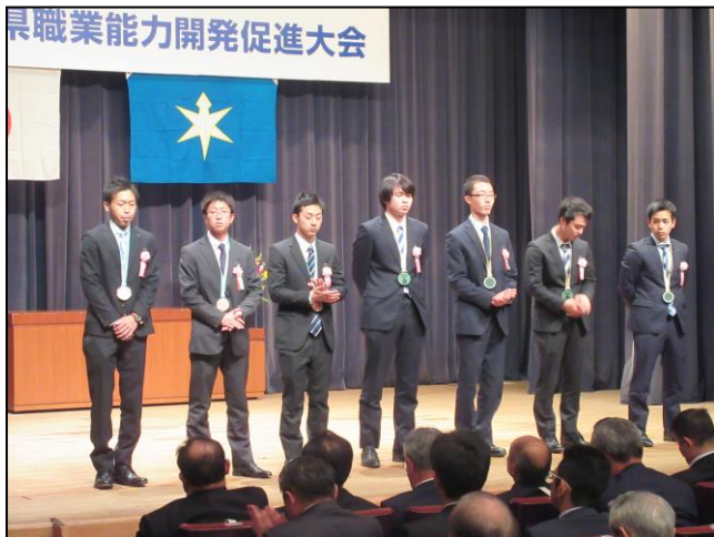
全国技能競技大会入賞者 (第55回技能五輪全国大会)