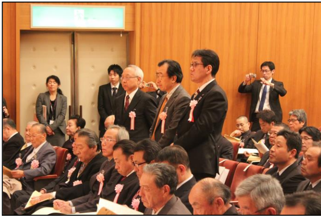
職業能力開発分野功労者（協会長表彰）