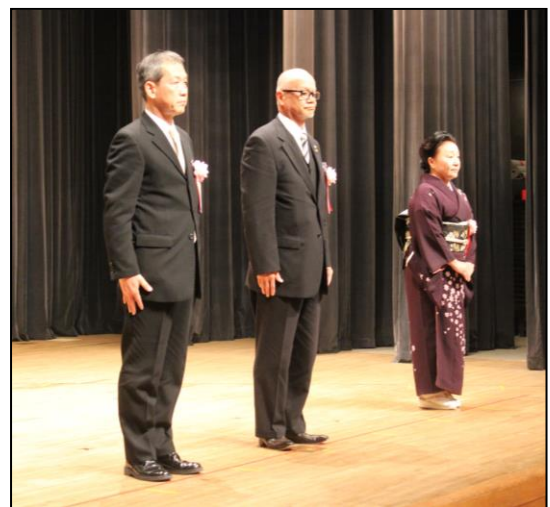
厚生労働大臣表彰受賞者 (卓越した技能者 (現代の名工))