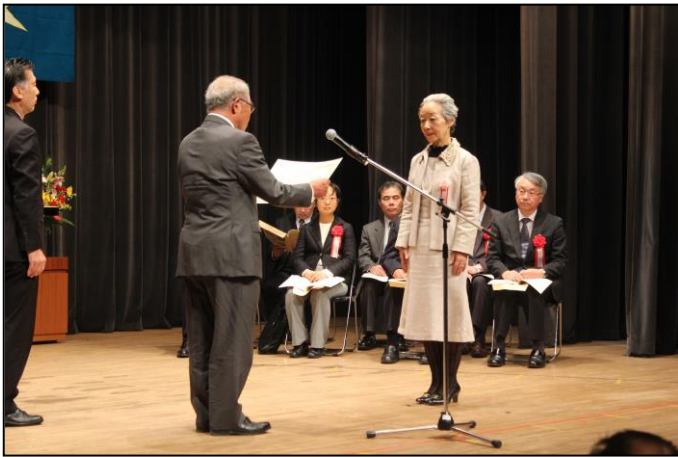
千葉県技能士会連合会長表彰受賞者