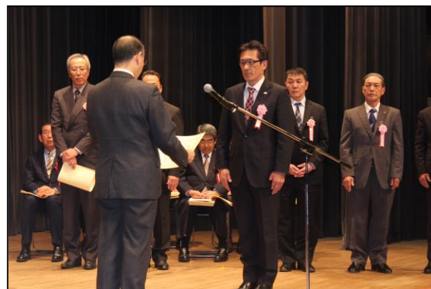
千葉県の卓越した技能者