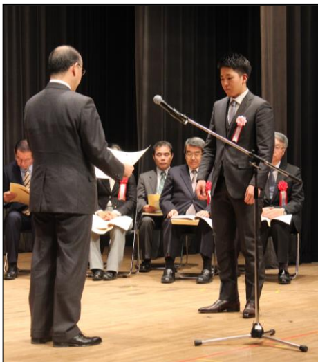
千葉県技能祭（知事賞）