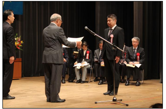
千葉県技能祭 (技能士会連合会長賞)